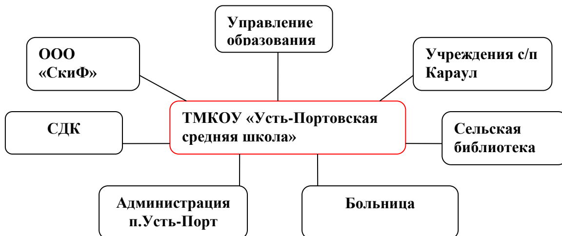
Схема - социальные партнеры

Обладая ценностью индивидуального развития человека, школа становится организатором развивающей учебно-воспитательной среды, главное назначение которой состоит в том, чтобы в этой среде каждый обучающийся, по возможности, начал проявлять свою мыслительную активность в рассуждении, воображении, догадках, в коммуникации, мотивированно включаясь в различные виды работы. Развивающая учебно-воспитательная среда учебного заведения представляет систему деловых и межличностных взаимоотношений, выступающую условием и критерием развития человека в интеллектуальной, социальной и личной сфере. Создание развивающего пространства в школе позволяет ребенку осознать собственные возможности, проявить инициативу, всесторонне реализовывать себя и формировать компетенции, необходимые для успешной социализации. Существует острая потребность в образовательных учреждениях на селе, которые способны бережно хранить нравственные ценности, воспитывать в детях высокие духовные потребности, любовь и уважение к прошлому своей страны, своих предков. При организации образовательного процесса необходимо учитывать и специфику сельского социума: