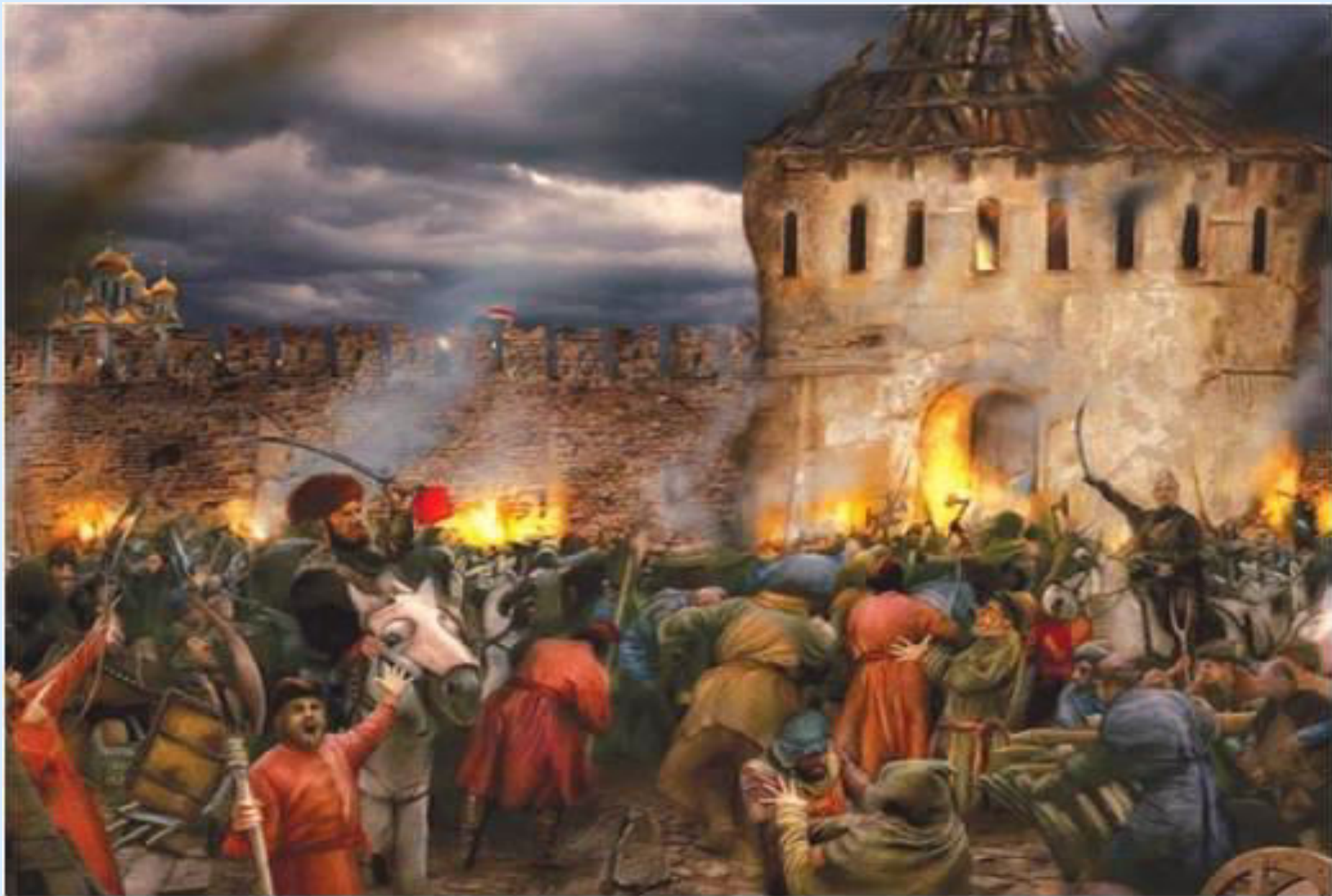
Вход Минина и Пожарского в Китай-город